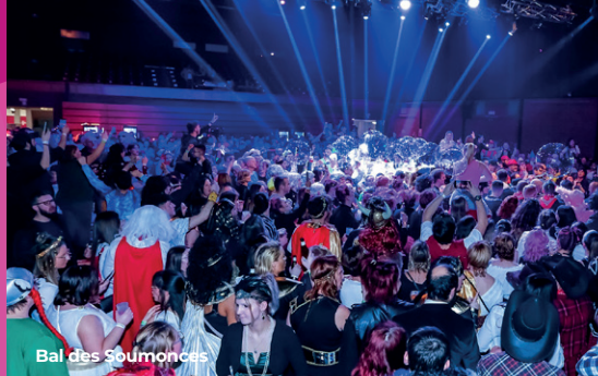
Bal des Soumonces