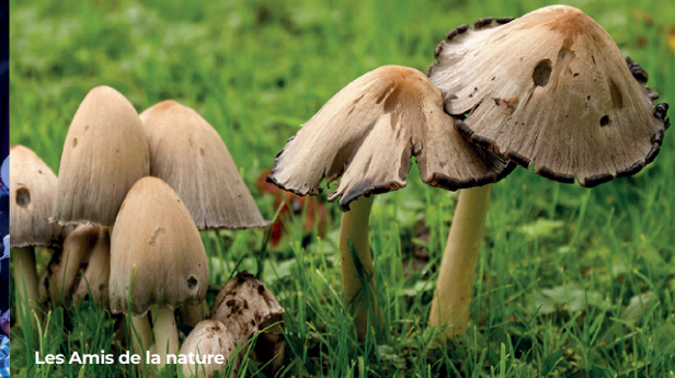
Les Amis de la nature